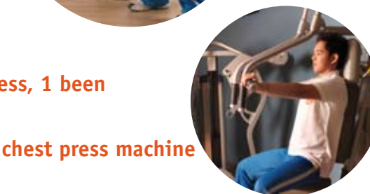
chest press machine